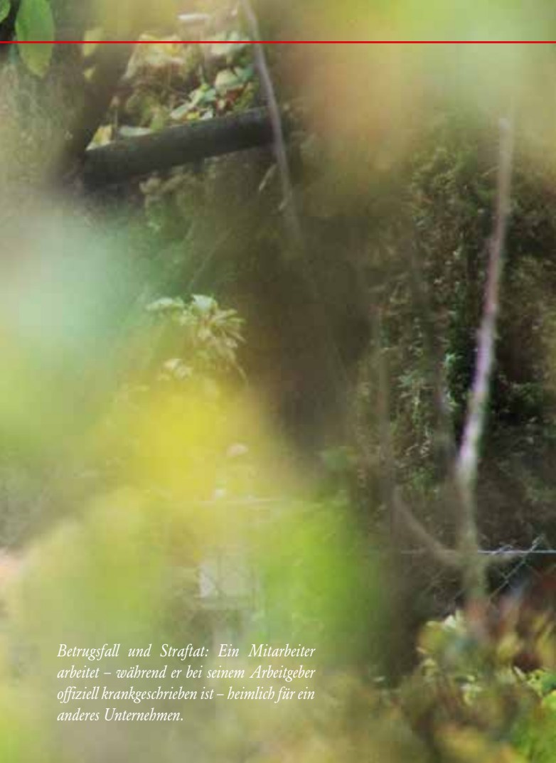
Betrugsfall und Straftat: Ein Mitarbeiter arbeitet – während er bei seinem Arbeitgeber offiziell krankgeschrieben ist – heimlich für ein anderes Unternehmen.

mer, aber auch Rechtsanwälte, Notare und Steuerberater, die im Namen ihrer Mandantschaft tätig werden.